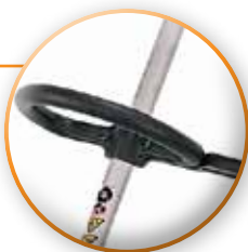
MANGO "B" SUJECION PARA CORTE HORIZONTAL Y VERTICAL