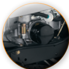
BOMBA Y FILTRO DE ACEITE VIDA EXTENDIDA DEL MOTOR.