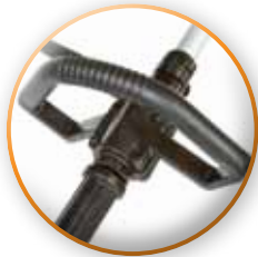
MANUERIO PARA MÁXIMA MANIOBRABILIDAD.