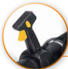
BLOQUE DE GATILLO PARA USO CONTINUO