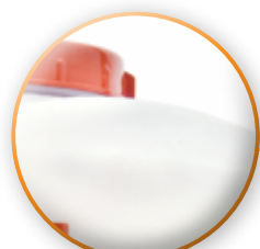
TANQUE PARA PARA POLVO O LIQUIDO DE 17 LITROS.

INDISPENSABLE PARA HUERTAS, CAMPOS AGRICOLA, BAGONES DE TREN Y JARDINES.