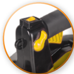
BLOQUE DE GATILLO PARA USO CONTINUO

EXCELENTE EQUIPO PARA BARRER RAPIDAMENTE CALLES, BANQUETAS, PARQUES Y JARDINES CON LA COMODIDAD DE SER LIGERA.