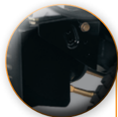
PUNTE FRONTAL FORJADO PARA USO MUY RUDO.