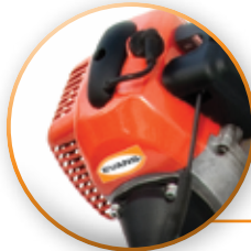
MOTOR 43CC EXCELENTE POTENCIA Y LARGA VIDA.