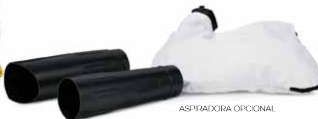
ASPIRADORA OPCIONAL ABJ-ASP-4T