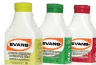
25:1 40:1 50:1