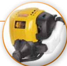
MOTOR 4 TIEMPOS MAXIMA EFICIENCIA Y DURABILIDAD