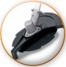
CABEZAL PROFESIONAL USO RUDO