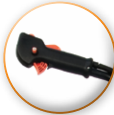
MANUBRIO PARA MÁXIMA MANIOBRABILIDAD.