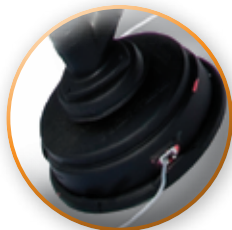
CABEZAL PROFESIONAL SALIDA A GOLPE 2 HILOS DE 0.105"