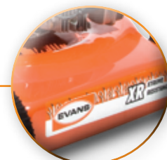
CUERPO MAS DURABLE Y RESISTENTE

PINTURA HORNEADA INCLUSIVE DENTRO DE LA CARCAZA.