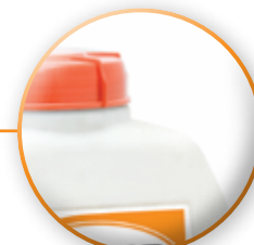
TANQUE EL TANQUE MAS GRANDE DEL MERCADO.