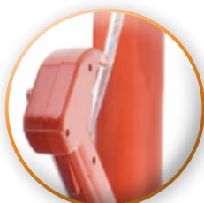
CAÑON EXTRA LARGO PARA UN MAYOR ALCANCE DE ROCIO.