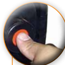
CEBADOR EN FRIO

JUNTA EL PASTO PARA HACER MAS FACIL LA RECOLECCION.