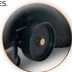
RUEDA ESTABILIZADORA CORTE PAREJO Y AL RAZ.