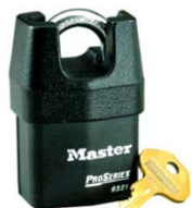
MAXIMA SEGURIDAD BLINDADO