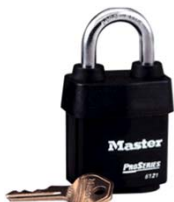
P/EXTERIOR DE POLVO Y LLUVIA