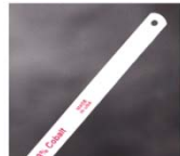
SEGUETAS MANUALES BIMETALICAS