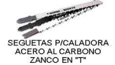
SEGUETAS P/CALADORA ACERO AL CARBONO ZANCO EN "T"