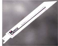
SIERRA SABLE SEGUETAS SABLE BIMETALICA