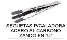
SEGUETAS P/CALADORA ACERO AL CARBONO ZANCO EN "U"