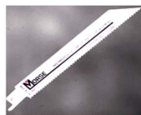
SEGUETAS SABLE BIMETALICA