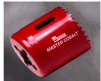
BROCA SIERRAS BIMETALICAS